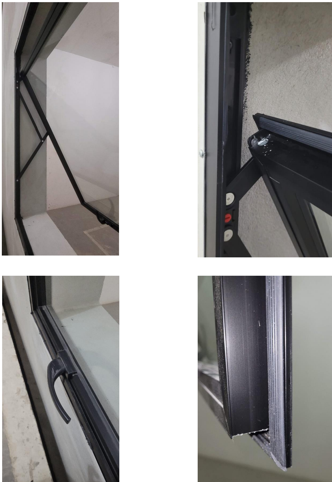
Figura A.3 – Detalhes construtivos e de instalação da amostra

Laboratório de Ensaio acreditado pela Cgcre de acordo com a ABNT NBR ISO/IEC 17025, sob o número CRL 1424