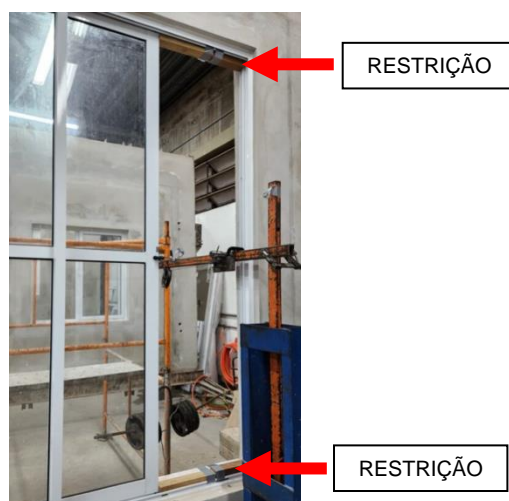
Figura 3 – Instrumentação de ensaio de resistência horizontal com dois cantos imobilizados

O método de ensaio é apresentado no Anexo I da ABNT NBR 10821-3:2017. É aplicada uma força de 400 N paralela à folha interna da esquadria no eixo vertical do seu perfil. Imobilizam-se os dois cantos da folha, restringindo sua movimentação horizontal, conforme é apresentado na Figura 3. Durante e após o ensaio, são registradas as ocorrências no corpo de prova.